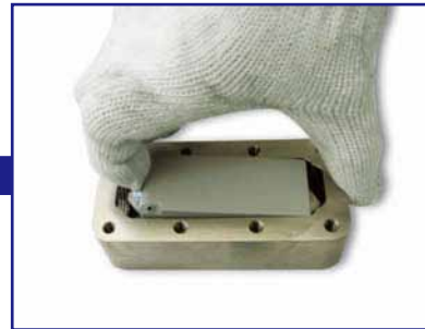
中のカセットから本体を取り出す。