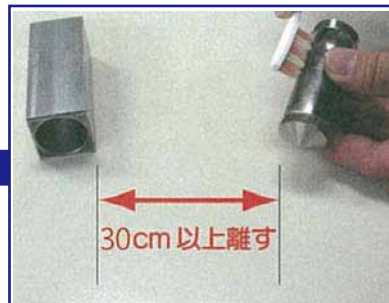
磁石とカセットをそれぞれ水洗いし、ゴミや汚れを落とす。