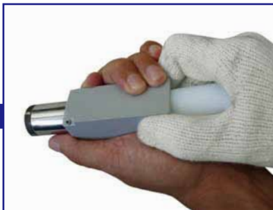
押し出し治具を使いカセットから磁石を押し出す。