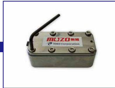
6角レンチでボルトを緩めカバーを外す。