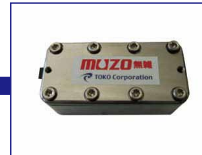
手順を逆にして組み立てる。